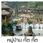
หมู่บ้าน กัด กัด