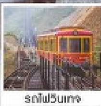
รถไฟวินเทจ