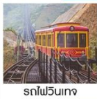
รถไฟวินเทจ