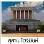
สุสาน โฮจิมินห์