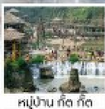
หุบป่าัน ถัด กัด