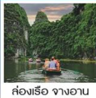
ล่องเรือ จางอาน