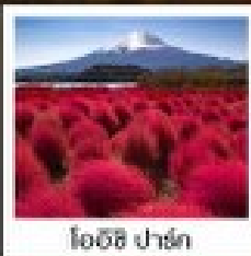
โอดิชิ ฟูจิ