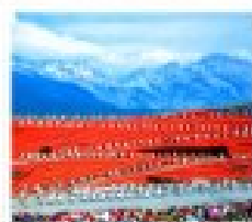
ไร่ชาดงต้าหลี่