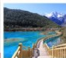
น้ำพุร้อน