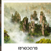
เขาอวตาร