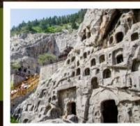
ถ้ำหินหลงเหมิน