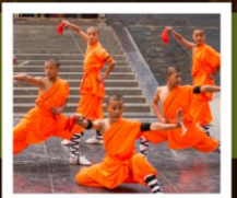
โชว์เส้าหลิน

PERIOD 1 : 9 - 14 สิงหาคม | PERIOD 2 : 18 - 23 ตุลาคม 2567