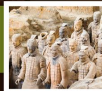
สุสานจีนซี

วัดเส้าหลิน / ป่าเจดีย์ / โชว์การแสดงวิทยายุทธเส้าหลิน / อุทยานหยุนโกซาน ศาลเจ้ากวนอู / ถ้ำหินหลงเหมิน / สุสานทหารจีนซี / ถนนคนเดินวัฒนธรรมต้าถิง โชว์ราชวงศ์ถัง / ทำแพงเมืองโบราณซีอาน / วัดลามะ / ตลาดมุสลิม