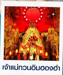
เจ้าแม่กวนอิมสองอ้า