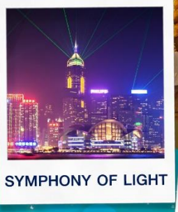
SYMPHONY OF LIGHT