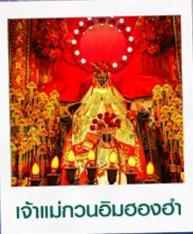
เจ้าแม่กวนอิมสองฮ่า