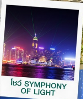
โชว์ SYMPHONY OF LIGHT