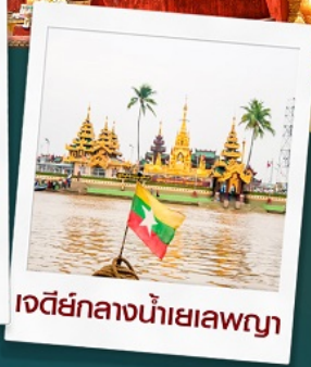
เจดีย์กลางน้ำเยเลพญา