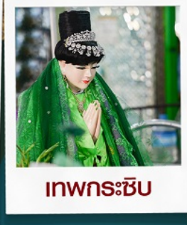
เทพกระซิบ