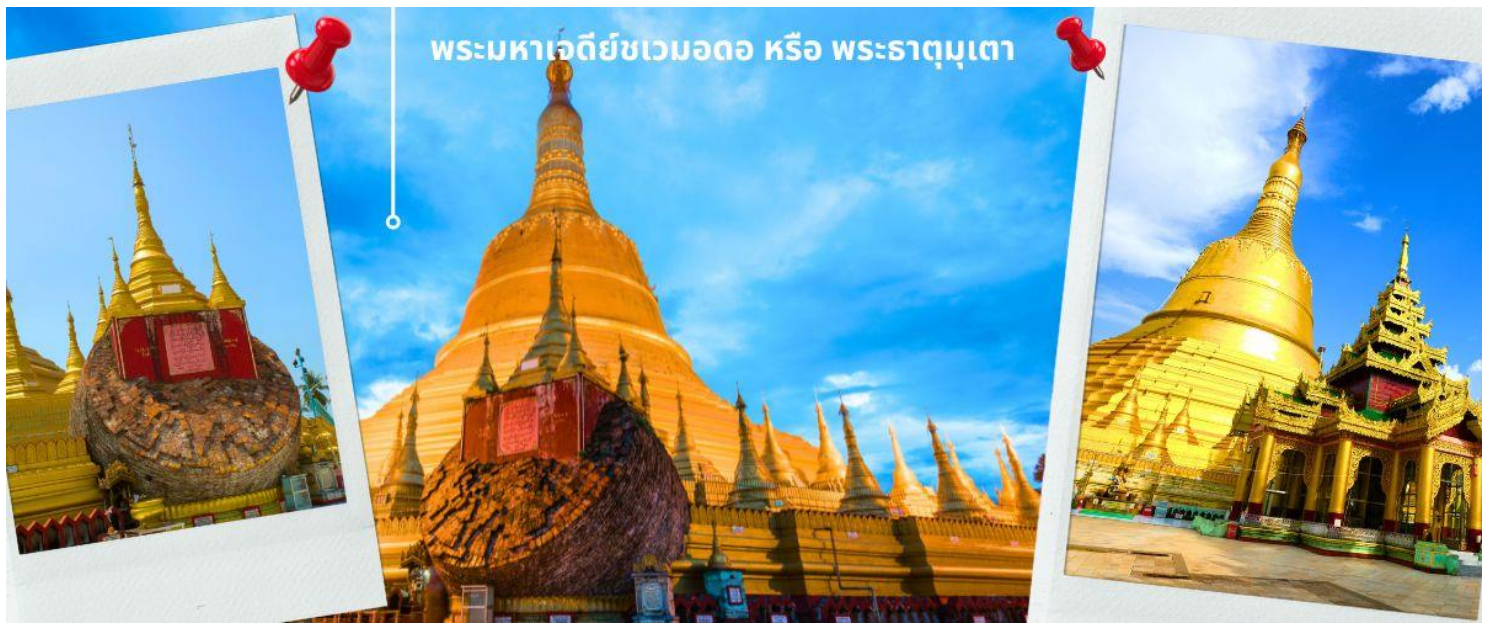
พระมหาเจดีย์ชเวมอดอ หรือ พระธาตุมุเตา

จากนั้นท่านกราบนมัสการ พระมหาเจดีย์ชเวมอดอ หรือ พระธาตุมุเตา เจดีย์ที่เป็น 1 ใน 5 สิ่งศักดิ์สิทธิ์สูงสุดแห่งพม่า เจดีย์ชเวมอดอมีชื่อเรียกในภาษามอญซึ่งคนไทยคุ้นเคยกับชื่อนี้คือ พระธาตุมุเตา แปลว่า "จมูกร่อน" เพราะกล่าวกันว่าพระเจดีย์องค์นี้สูงมาก ต้องแหงนหน้ามองจนต้องกับแสงแดด ปัจจุบันเจดีย์ชเวมอดอมีความสูงที่ 114 เมตร เป็นเจดีย์ที่สูงที่สุดในประเทศพม่า ในสมัยพระเจ้าตะเบ็งชเวตี้ ใช้เป็นที่ทำพระราชพิธีเจาะพระกรรณเมื่อครั้งพระองค์ขึ้นครองราชย์ใหม่ ๆ ที่ต้องอยู่ ภายใต้วงล้อมของทหารมอญหลายหมื่น