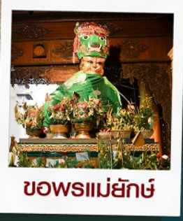
ขอพรแม่ยกษ์