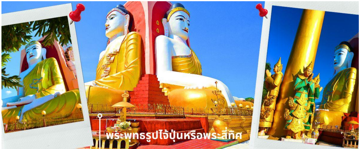
พระพุทธรูปไจ้ปุ่หรือพระสีทศ

นำท่านเดินทางสู่ เมืองหงสาวดี หรือ เมืองพะโค ซึ่งในอดีตเป็นเมืองหลวงที่เก่าแก่ที่สุด ของเมืองมอญโบราณที่ยิ่งใหญ่และอายุมากกว่า 400 ปี อยู่ห่างจากย่างกุ้ง (ระยะทางประมาณ 80 กิโลเมตร ใช้เวลาเดินทางประมาณ 1.45 ชม.) นำท่านนมัสการ พระพุทธรูปไจ้ปุ่หรือพระสีทศ เป็นพระเจดีย์ที่มีพระพุทธรูปปางมารวิชัยขนาดใหญ่ทั้ง 4 ด้านอายุกว่า 500 ปี หันพระพักตร์ไปยัง 4 ทิศ สร้างขึ้นโดย 4 สาวพี่น้องที่อุทิศตนแต่พุทธศาสนาจึงสร้างพระพุทธรูปเพื่อแทนตนเอง และได้สาบานไว้ว่าจะไม่ข้องแวะกับบุรุษเพศ ต่อมาน้องสาวคนสุดท้อง กลับพบรักกับชายหนุ่มและแต่งงานกัน จึงเกิดอาเพศฟ้าผ่าพระพุทธรูปที่แทนตัวของน้องสาวคนสุดท้องพังทลายลงมา และมีการบูรณะขึ้นมาใหม่จึงทำให้พระพุทธรูปองค์นี้จะมีลักษณะ แตกต่าง