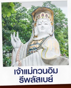
เจ้าแม่กวนอิม ธวัชลาเบย์