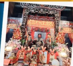
เทพเจ้ากวนอู วัดกวนไท