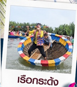
เรือกระดิ่ง