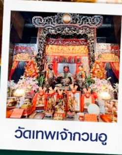
วัดเทพเจ้ากวนอู