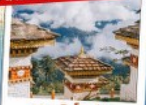
จุดชมวิวดอชูล่า (DOCHULA)