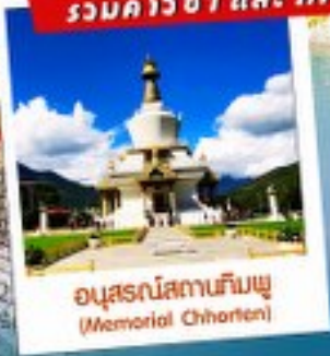
อนุสรณ์สถานทิมพู (Memorial Chhorten)