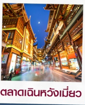
ตลาดเดินห้างเมี่ยว