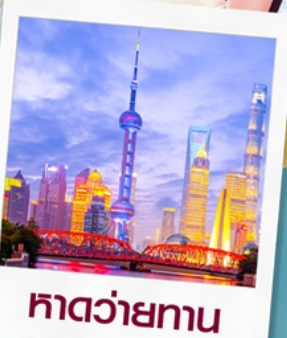
ทิวทัศน์