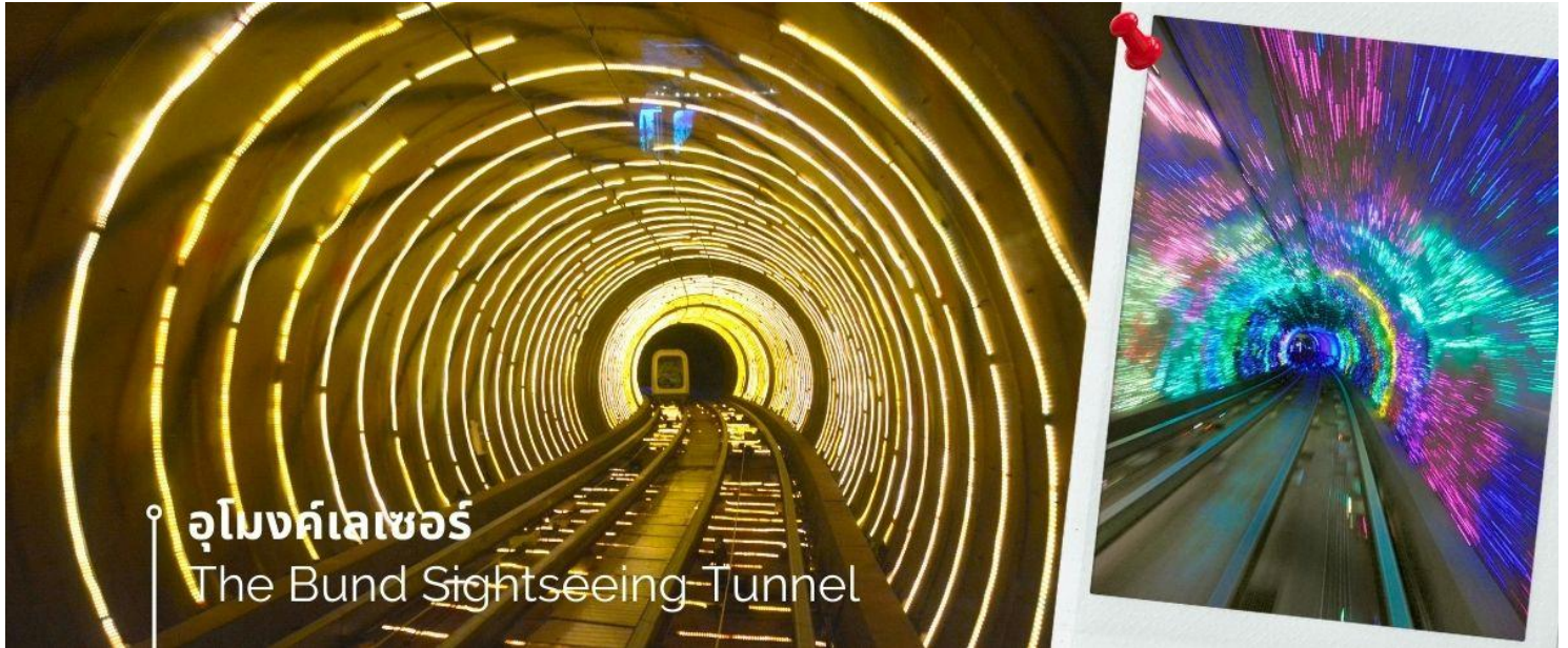
อุโมงค์เลเซอร์ The Bund Sightseeing Tunnel

จากนั้นนำท่านเปิดประสบการณ์ใหม่กับ The Bund Sightseeing Tunnel อุโมงค์เลเซอร์ เชียงไฮ้ ถูกสร้างขึ้นเพื่อให้ใช้เป็นเส้นทางขนส่งนักท่องเที่ยวกรุ๊ปใหญ่ๆ ที่มาเที่ยวที่นครเชียงไฮ้ ทางการเชียงไฮ้ได้ติดตั้งระบบแสงสีเสียงสุดอลังการภายในอุโมงค์แห่งนี้ ทำให้ช่วงเวลาระหว่างอยู่บนรถอัตโนมัติภายใต้อุโมงค์แห่งนี้ เหมือนอยู่ในอีกโลกหนึ่ง