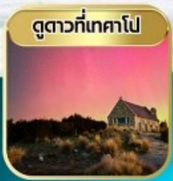
ดูดาวที่เทศาโป