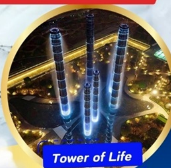
Tower of Life