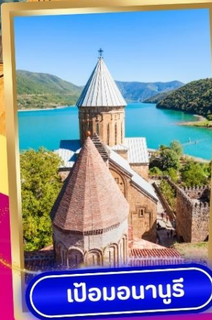
เป็อมอนาบุรี

จอร์เจีย ชมวิวหลักล้าน 6วัน 4คืน ปักหมุดเขาในอ้อมกอดเขาคอเคซัส