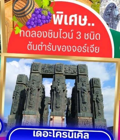
เดอะโครนเคิล ออฟ จอร์เจีย

พิเศษ.. ทดลองชิมไวน์ 3 ชนิด ต้นตำรับของจอร์เจีย