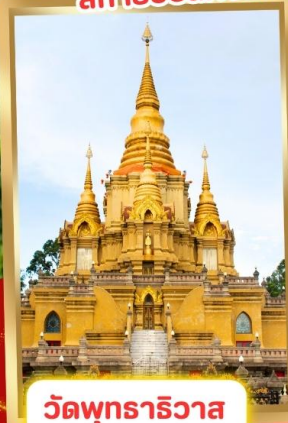
วัดพุทธาริวาส