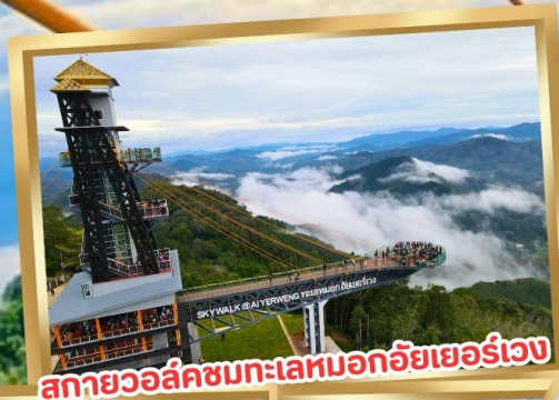
สกายวอล์คชมทะเลหมอกอัยเยอร์เวง

ร่วมโครงการ ลดหย่อนภาษี ลดสูงสุด 15,000.-