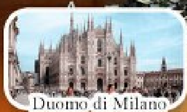
Duomo di Milano