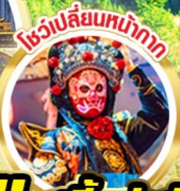
โรงบลิ้นหม่ากัก