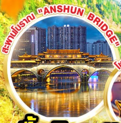
สะพานโบราณ "ANSHUN BRIDGE"