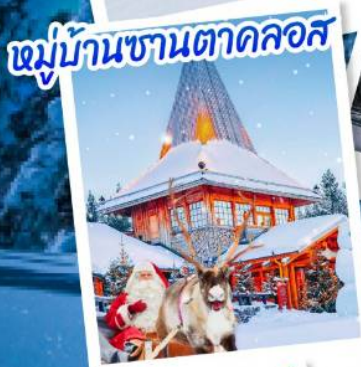
หมู่บ้านซานตาคลอส