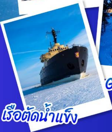
เรือตัดน้ำแข็ง