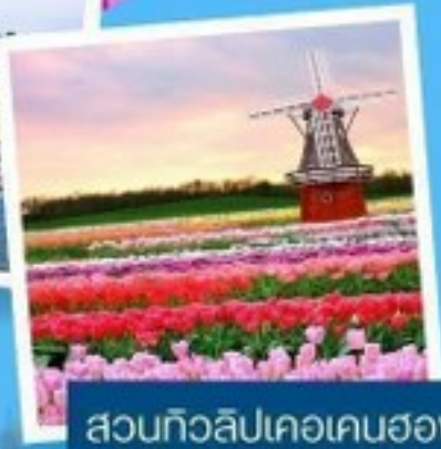
สวนทิวลิปเคอเคนฮอฟ

สวิตเซอร์แลนด์ เนเธอร์แลนด์ เยอรมัน 8 วัน