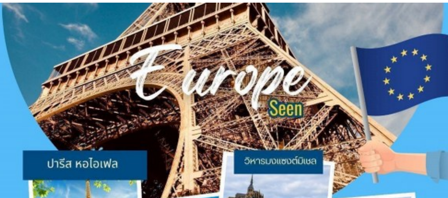
ปารีส หอไอเฟล