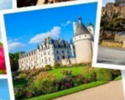
ปราสาทชองโซ