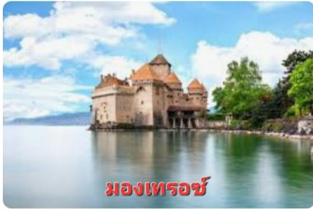
มงเทรอซ์

ออกเดินทางสู่ เมืองมงเทรอ (MONTREUX) (140 กม.) ...ระหว่างทางแวะถ่ายภาพความงดงามของ ปราสาท