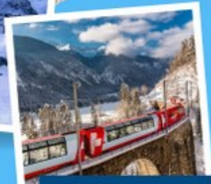
รถไฟเส้นทางกลาเซีย