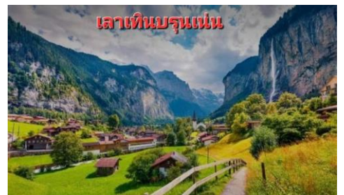
เลาเทินบรุนเน่น

บ่าย จากนั้นอิสระให้ท่านมีเวลาอย่างเต็มที่ที่จะเก็บภาพที่ระลึกบนลานกว้างที่เต็มไปด้วยหิมะชาวโพลนให้ท่านได้สนุกสนานอย่างเต็มอิม จนถึงเวลาอันสมควร จึงนำท่านเดินทางกลับโดยใช้เส้นทางที่สวยแสนโรแมนติกอีกเส้นทางหนึ่ง โดยการนั่งรถไฟชมวิวกว๊าทซ์อีกฝั่งสู่ เมืองเลเทียร์ นบรุนเน่น (LAUTER BRUNNEN) ...เดินทางถึงเมืองลูเซิร์น