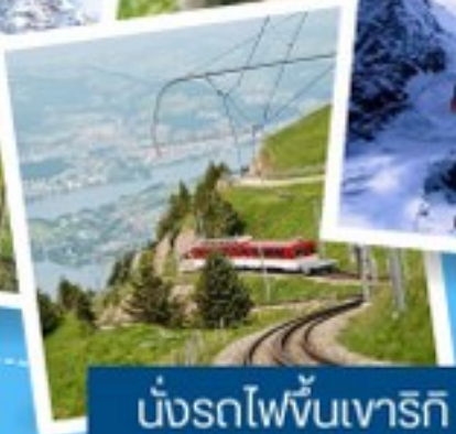
นั่งรถไฟขึ้นเทรริท