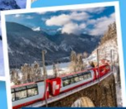
รถไฟเส้นทางกลาเซีย