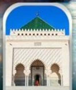
MOHAMMED V SQUARE