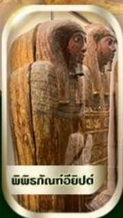
พีพีร์กัทกรีกอียิปต์