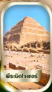
พีระมิดโจเซอร์