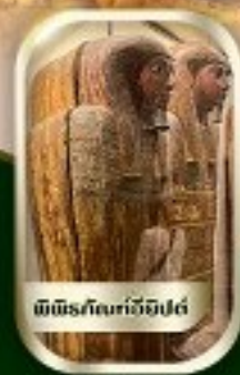
พิพิธภัณฑ์อียิปต์