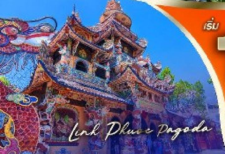
Linh Phuoc Pagoda