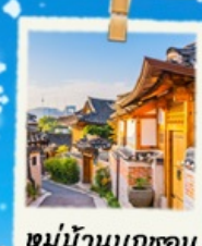
หมู่บ้านนูกซอน