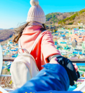
หมู่บ้านคัมซอน