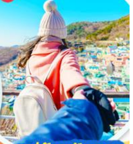
หมู่บ้านคัมซอน

สายการบินแอร์ปูซาน (BX) <ชั้นเครื่องสุวรรณภูมิ>