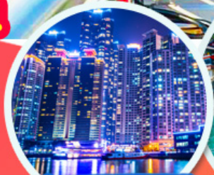
The Bay 101