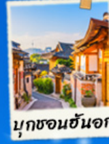
มุกซอนอันอก