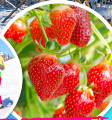
ไร่สตรอว์เบอร์รี่