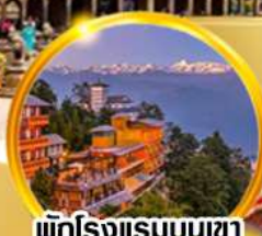
พักโรงแรมบนเขา ชมวิวหิมาลัยสุดฟิน