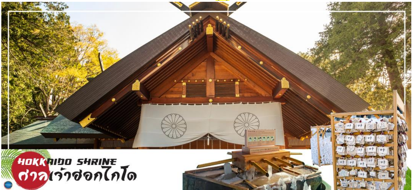
HOKKAIDO SHRINE ศาลเจ้าฮอกไกโด

จากนั้นนำท่านเดินทางสู่ เมืองซัปโปโร (SAPPORO) (ใช้เวลาเดินทางประมาณ 1.20 ชั่วโมง) นำท่านขอพร ศาลเจ้าฮอกไกโด (Hokkaido Shrine) หรือเดิมชื่อ ศาลเจ้าซัปโปโร เปลี่ยนเพื่อให้สมกับ ความยิ่งใหญ่ของเกาะเมืองฮอกไกโด ศาลเจ้าชินโตนี้คอยปกป้องรักษา ให้ชนชาวเกาะฮอกไกโดมีความสุขถึงแม้จะไม่ได้มีประวัติศาสตร์อันยาวนาน