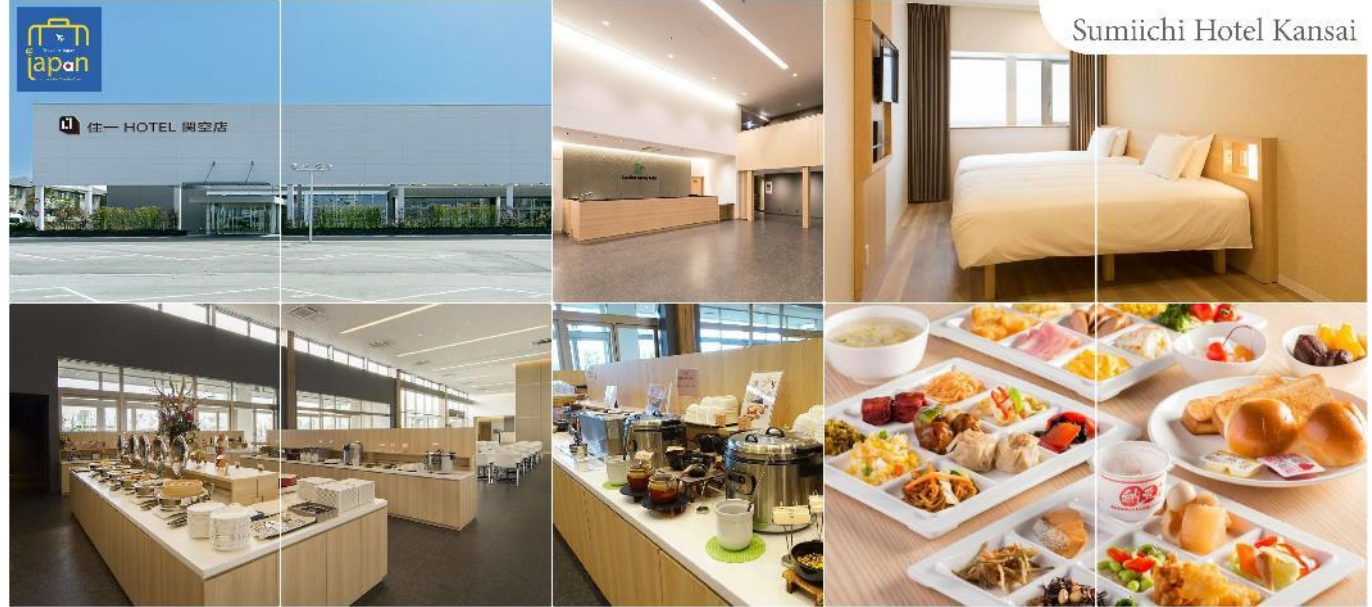
Sumiichi Hotel Kansai

พักที่ SUMIICHI HOTEL KANSAI หรือเทียบเท่าระดับเดียวกัน