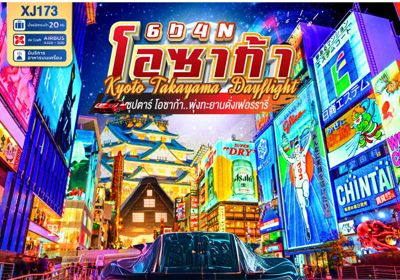
หมู่บ้านมรดกโลก