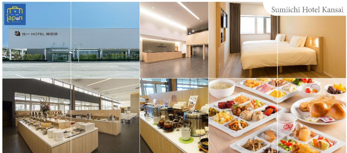
Sumiichi Hotel Kansai

พักที่ SUMIICHI HOTEL KANSAI หรือเทียบเท่าระดับเดียวกัน