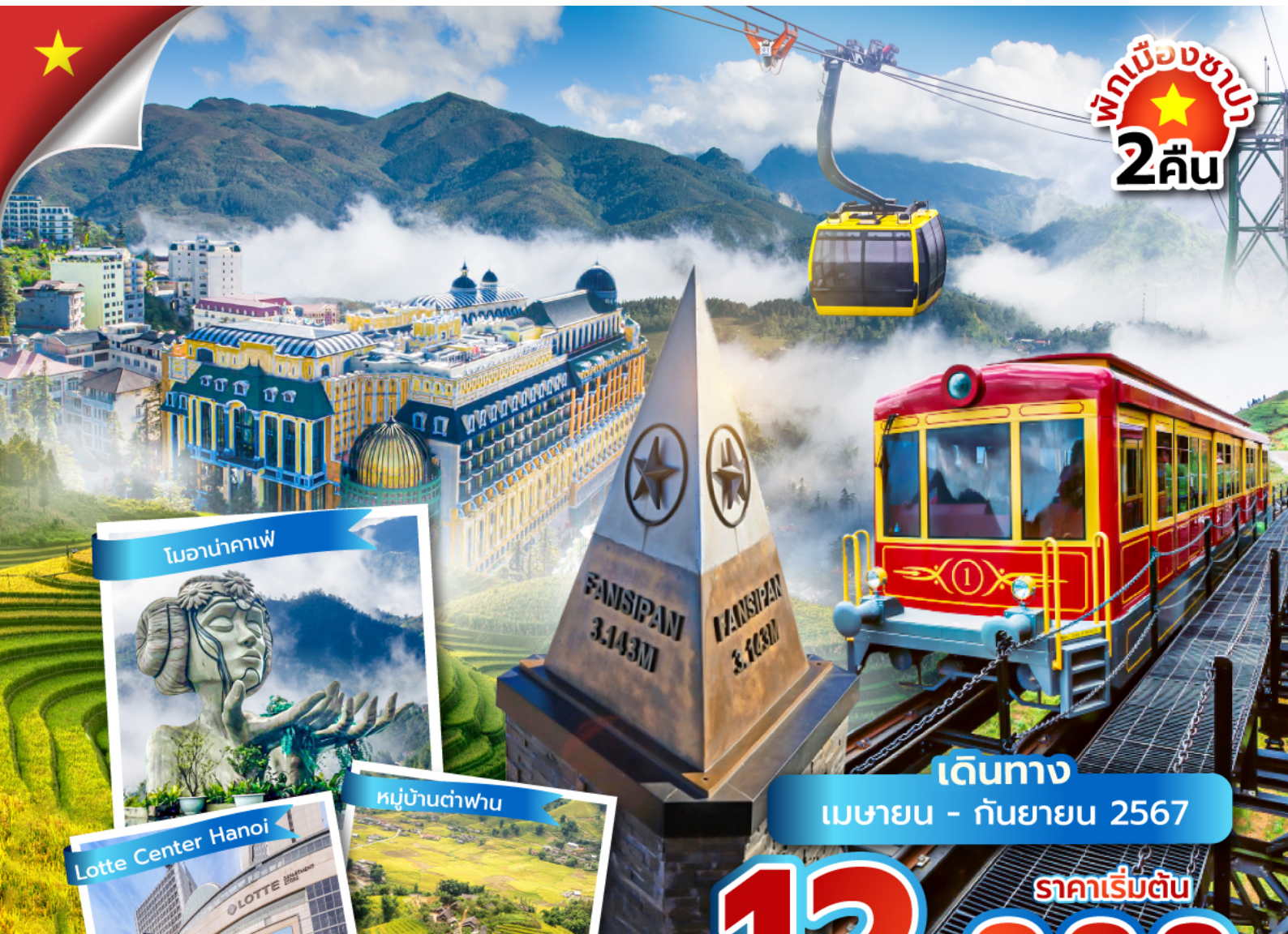
โอบานาคาเฟ่