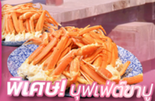
พิเศษ! มูฟเฟ็ตชามู