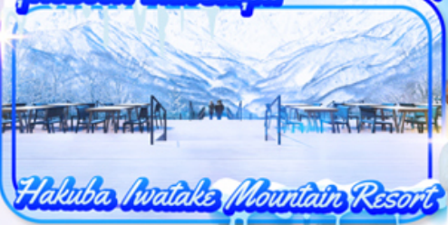
Hakuba Iwatake Mountain Resort