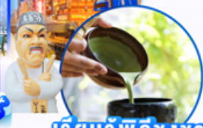
เรียนรู้พิธีชงชา