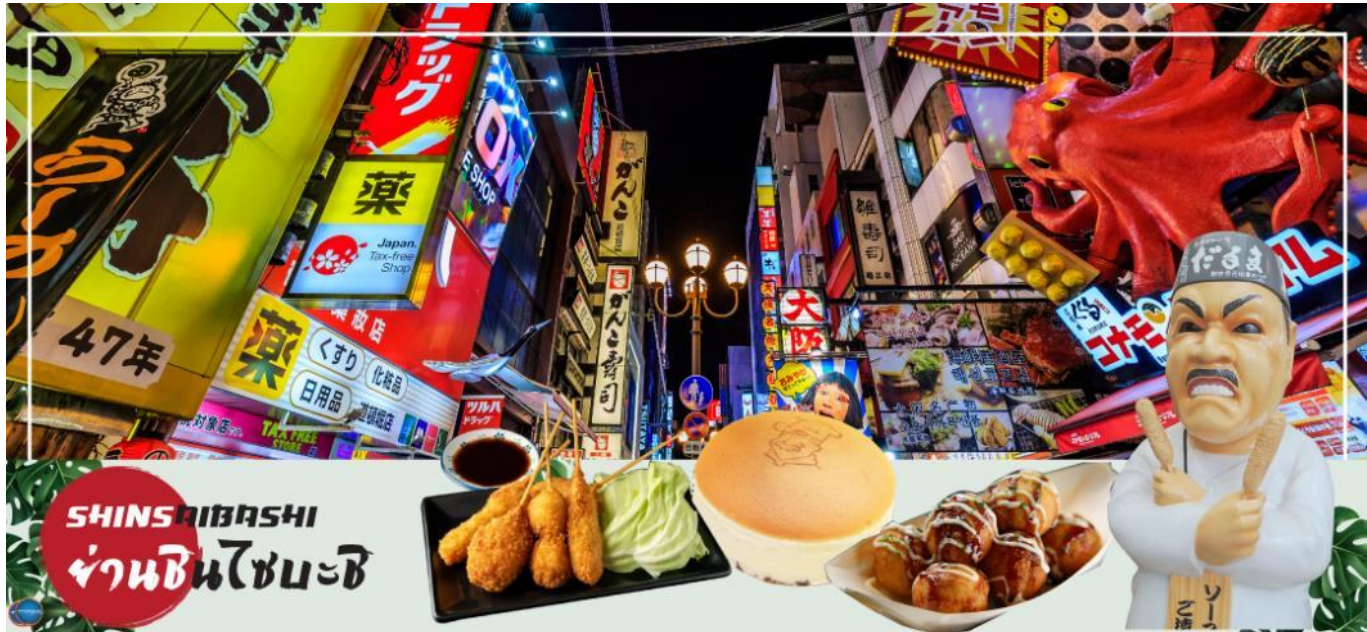
เย็น รับประทานอาหารเย็นอิสระตามอัธยาศัย

อิสระช้อปปิ้ง ย่านชินไซบาชิ (Shinsaibashi) บริเวณแหล่งช้อปปิ้งแห่งนี้มีความยาวประมาณ 600 เมตร เต็มไปด้วยร้านค้าปลีก ร้านแฟชั่นร้านเครื่องสำอางค์ ร้านรองเท้า กระเป๋า นาฬิกา ร้านกาแฟ ร้านอาหาร ร้านขนม ร้านเสื้อผ้าสตรีทแบรนด์ทั้งญี่ปุ่นและต่างประเทศ เช่น Zara H&M Beans ABC Mart เป็นต้น เรียกว่ามีทุกอย่างที่ต้องการรวมกันอยู่บริเวณนี้ ใกล้กันท่านสามารถเดินไปยัง ย่านโดทงโบริ (Dotonbori) ย่านบันเทิงยามค่ำดินตลอดแนวถนนเลียบบคลองโดทงโบริ จากสะพานโดทงโบริบาชิไปจนถึงสะพานนิปปอนบาชิ ไฮไลท์!!! ใครๆ ก็เชิดฉิ่ง ถ่ายภาพคู่ ป้ายกูลิโกะแมน หรือ ป้ายโดทงโบริกูลิโกะ (Dotonbori Glico Sign) เป็นป้ายไฟนีออนรูปนักกรีฑากำลังวิ่งอยู่บนลู่วิ่ง ซึ่งถูกติดตั้งมาตั้งแต่ ปี ค.ศ.1935 นอกจากนี้ยังมีอีกหนึ่งสัญลักษณ์สถานที่นัดพบกันหลง นั่นก็คือ ร้านปูคานิโดรากุ (Kani Doraku) ซึ่งมีปูยักษ์ขยับแขนและลูกตาได้อีกด้วย และห้ามพลาดสำหรับทาโกะยากิ อาหารท้องถิ่นของชาวโอซาก้า ที่มาถึงถิ่นแล้วต้องลอง Original Taste รับรองไม่ผิดหวังแน่นอน