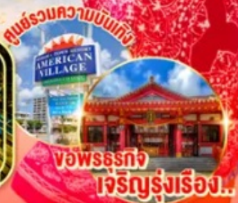
พ้อพรทจจ เจริญรุ่งเรือง!