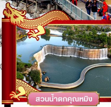
สวนน้ำตกคุนหมิง

✓ พิเศษ! โชว์จางอวิโหม่ว "ความประทับใจลี่เจียง"