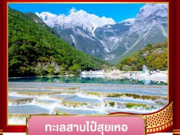
ทะเลสาบไป๋สุยเหอ