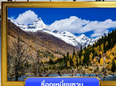
ชื่อภูเขาหิมะชาน