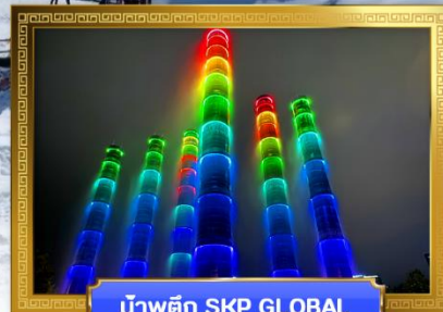
น้ำพุตึก SKP GLOBAL