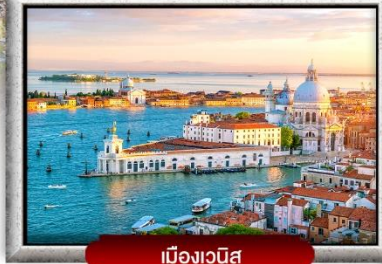
เมืองเวนิส

📍 ซอปปิง 4 เมือง ปารีส อินลาเก้น มิลาน โรม