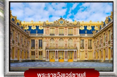
พระราชวังแวร์ซายส์

พิเศษ! หอยแอสคาโก้ | ชีสฟองดู 3 ชนิด | พิซซ่ามาริตต้า