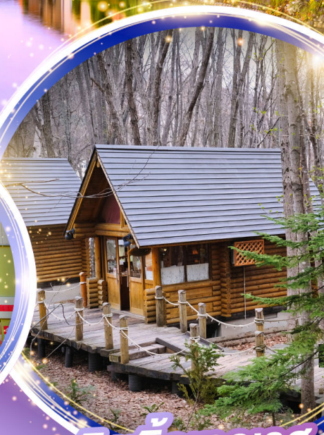
นิงเกิ้ลทอเรียช