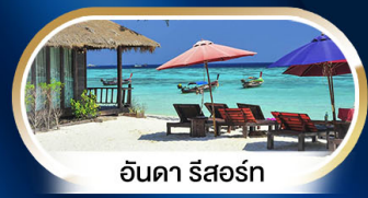
อันดา รีสอร์ท

บินตรง NOK AIR ** บินเข้า-ออก หาดใหญ่ **