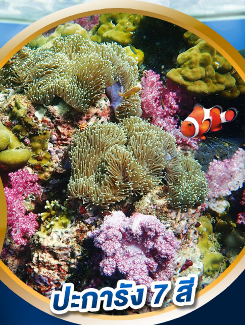
ปะการัง 7 สี