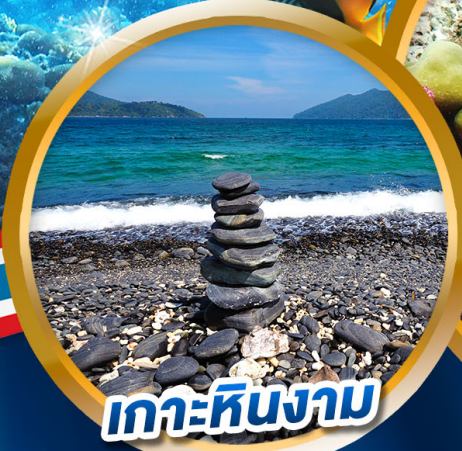
เกาะหินงาม