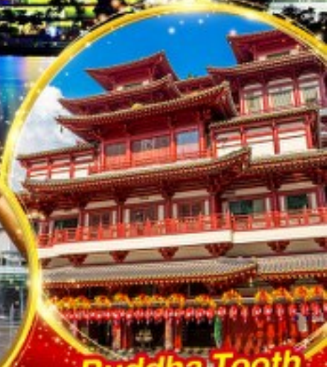
Buddha Tooth Relic Temple