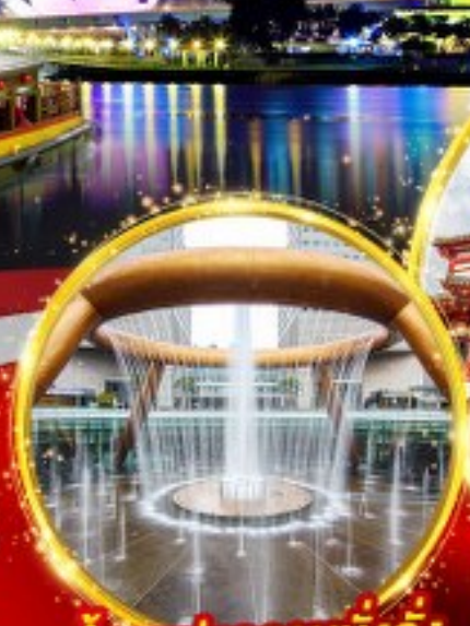
น้ำพุแห่งความมั่งคั่ง