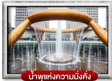
น้ำพุแห่งความมั่งคั่ง