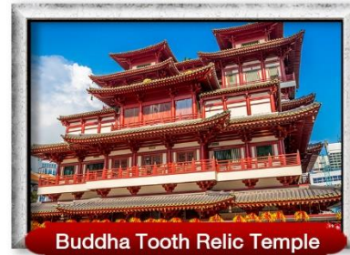
Buddha Tooth Relic Temple