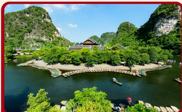
ล่องเรือจ้างอ่าง ชมวิถีกัญหลินแห่งเวียดนาม