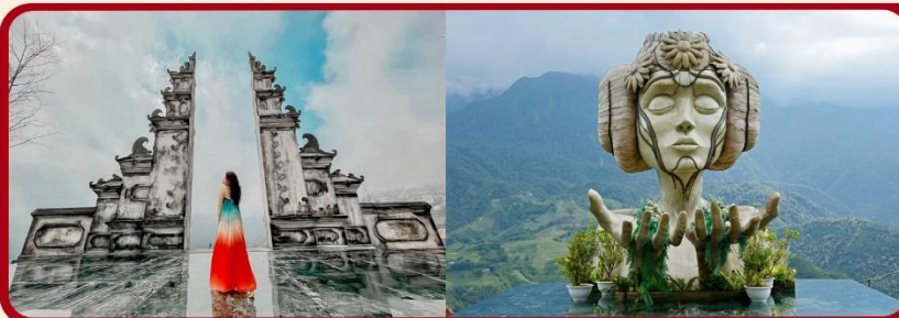
เซ็คอิน โมอาน่า (Moana Sapa Cafe)