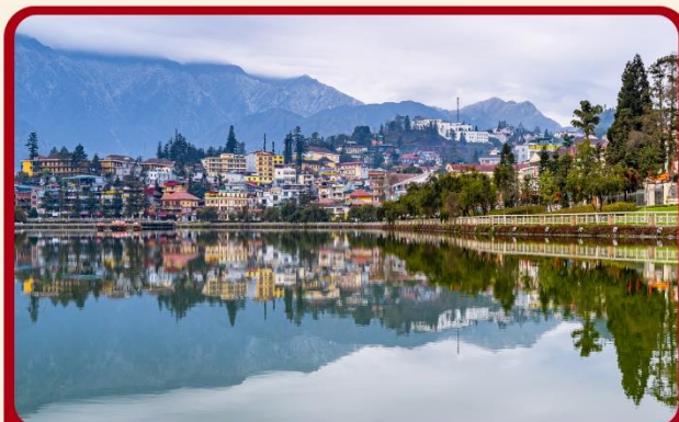
ทะเลสาบซาปา ทะเลสาบกลางเมืองซาปา