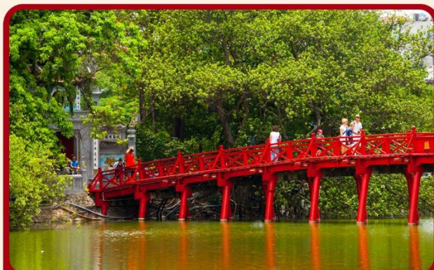
ชมสะพานแสงอาทิตย์ และ ทะเลสาบคินดาบ ทะเลสาบใจกลางเมืองฮานอย