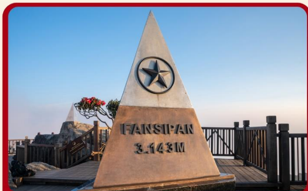
นั่งกระเช้าสู่ยอดเขาฟานซิปัน