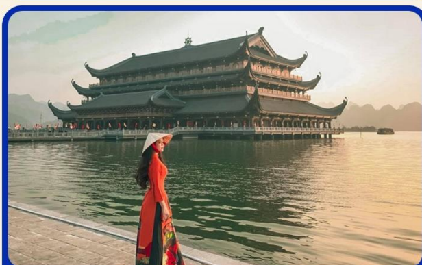
จุดเชคอินแห่งใหม่ “วัดตามจ๊ก”