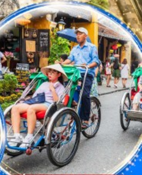
นั่งรถสามล้อซีโคล