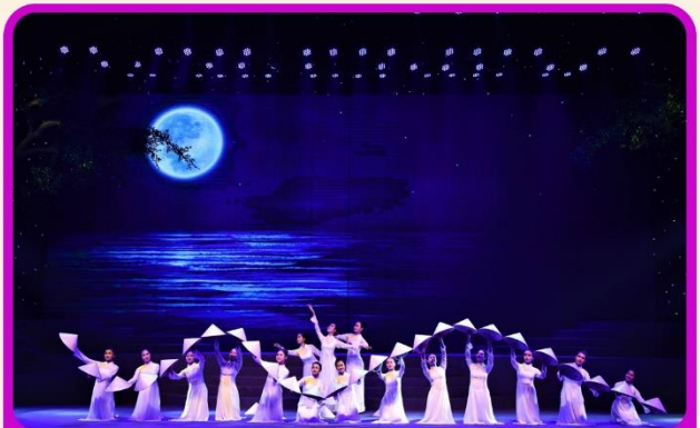
ชมการแสดง Charming Show Danang